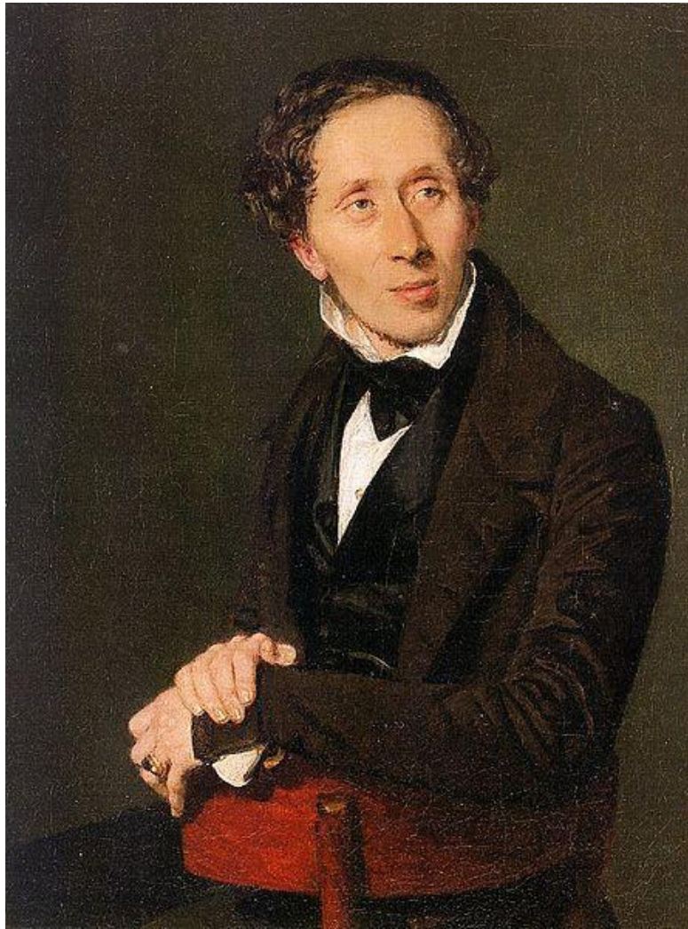
Hans Christian Andersen (1805 – 1875)